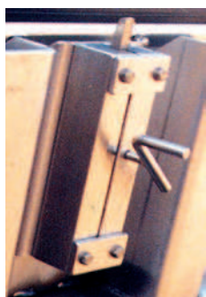
Handkurbel und Zahnstangenverschluss