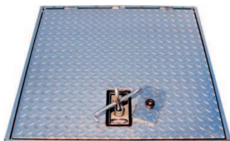
Schwerlastabdeckung mit aufgesetztem Bedienerschlüssel