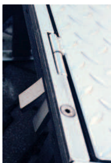
Mit dem Rahmen bündige Scharniere