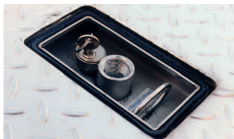
Bedieneröffnung mit Profizylinderschloss